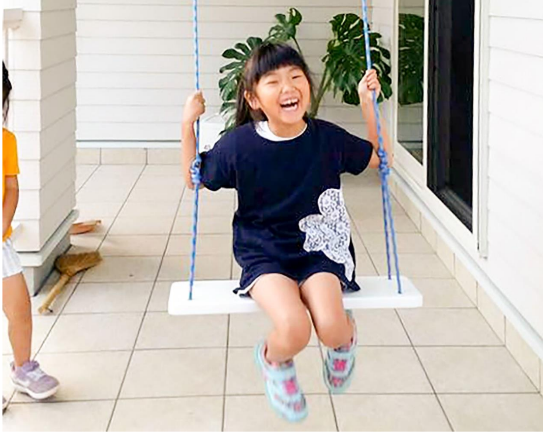
弊社施工のお家の玄関先にて