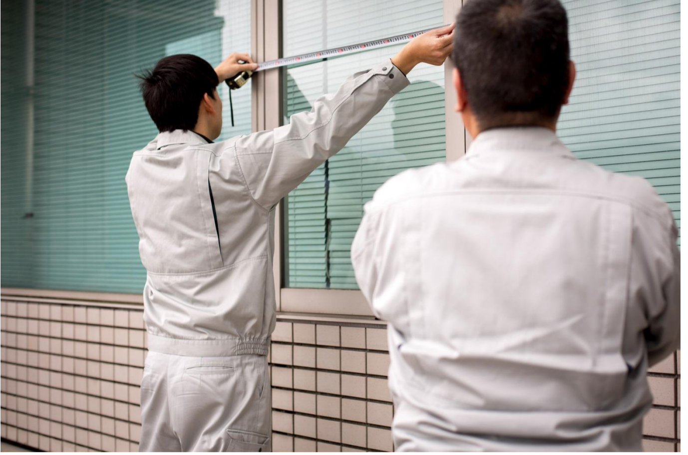
国の発展の一端を担っていることを誇りに思い、業務に従事しています。