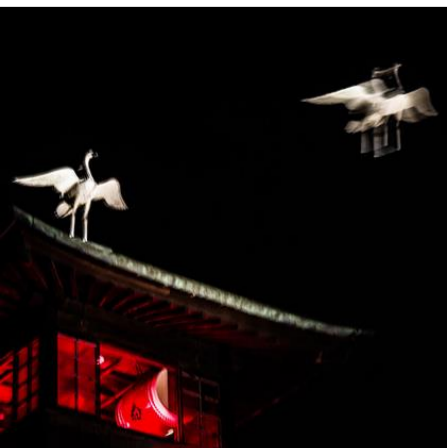
道後温泉本館をVRで後世に残す取組みも。

ある哲学書で、「人間の思考は、考えた瞬間では断片的な状態。それを「他の人」というフィルターを通すと、『あ、そうなのか』と、一人では気づけなかったことに気づかされる」といった表現がありました。