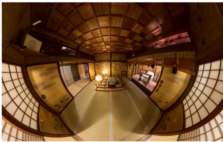
臨場感豊かに、従来の手法では伝えきれなかった魅力を伝えたい