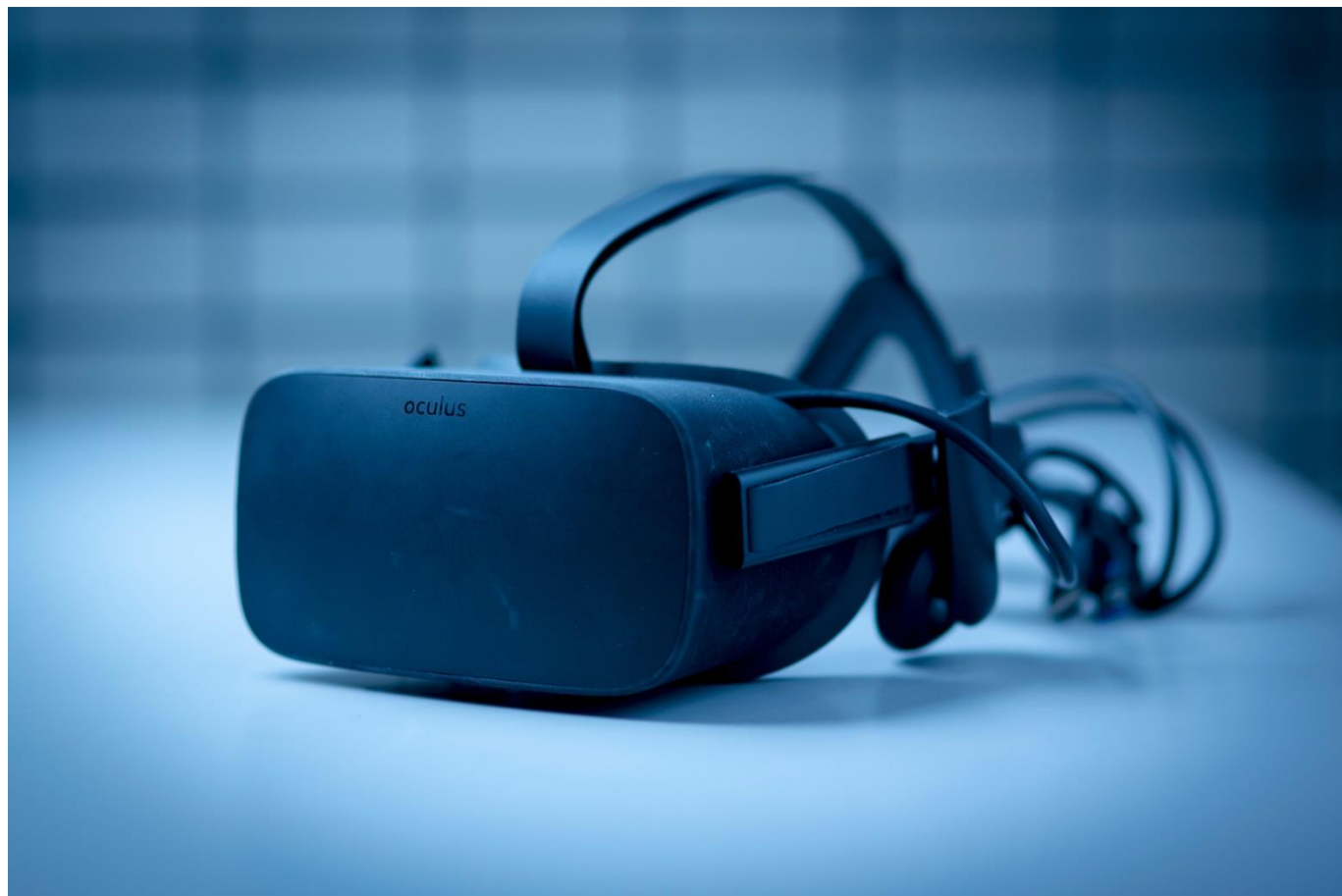
oculus(オキュラス)社製 3D-VRゴーグル