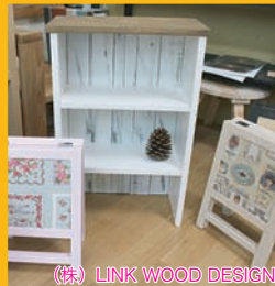
(株) LINK WOOD DESIGN