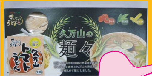
(株) サンヨーエンジニアリング 「まんなか」製麺所