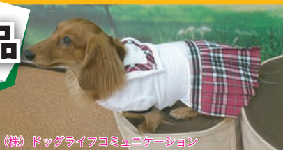
(株) ドッグライフコミュニケーション