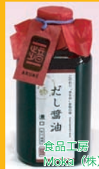
食品工房 Moka (株)