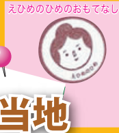
えひめのひめのおもてなし