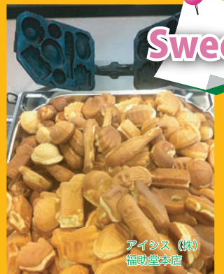
アイシス (株) 福助堂本店