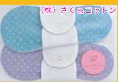
(株) さくらコットン