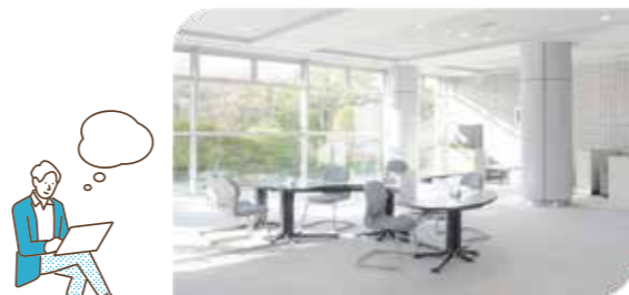
1F 交流サロン 利用時間/9:00~17:00