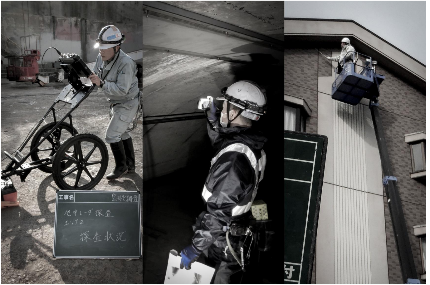
調査・診断の現場も、補修工事の現場も、両方を熟知しています。