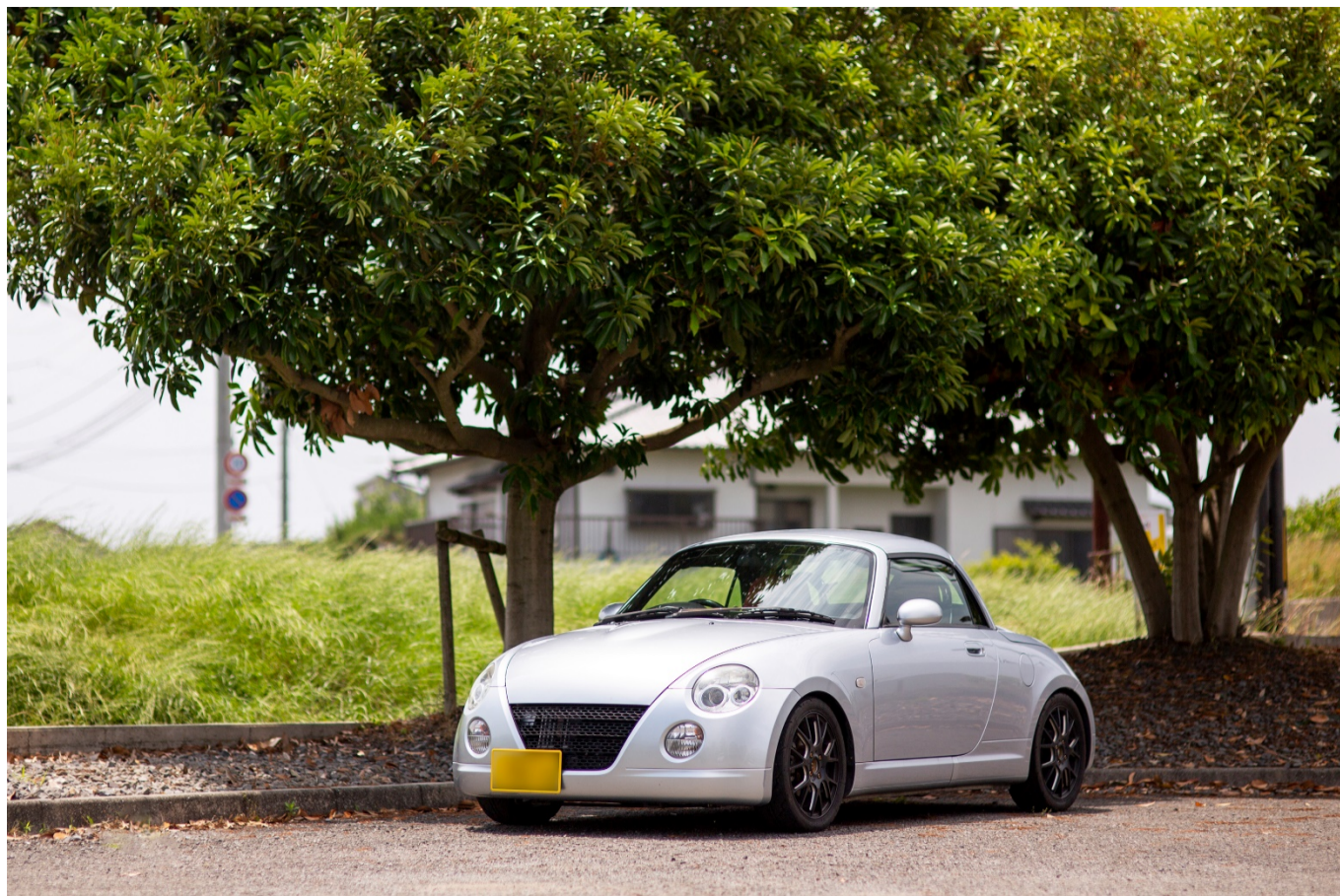
社長の愛車「Copen」。単なる移動手段としてだけではない、「車の楽しみ方」や「車遊び」をトータルプロデュースできる会社に。