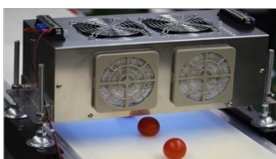
消費・賞味期限延長(UV活用)