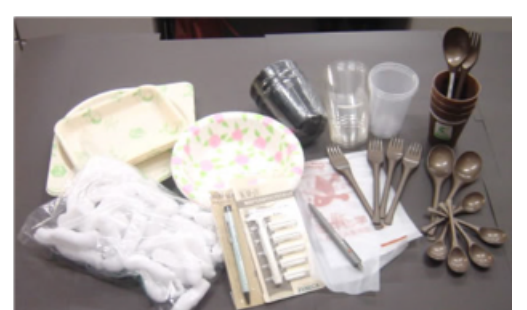
サステイナブル容器等(紙・プラ)